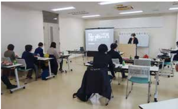
↑ ZOOM を使い会場から配信

2020年に北海道生協連様から頂きました支援金は豊平区に新たに建設しました「生活クラブ館・とよひら」で地域福祉を発信するために活用させていただきました。2021年に頂きました支援金につきましては地域で活動を行っている市民団体等への外部助成の一部として使用させていただきます。今後も地域福祉をひろげていけるように活動をすすめていきたいと思います。