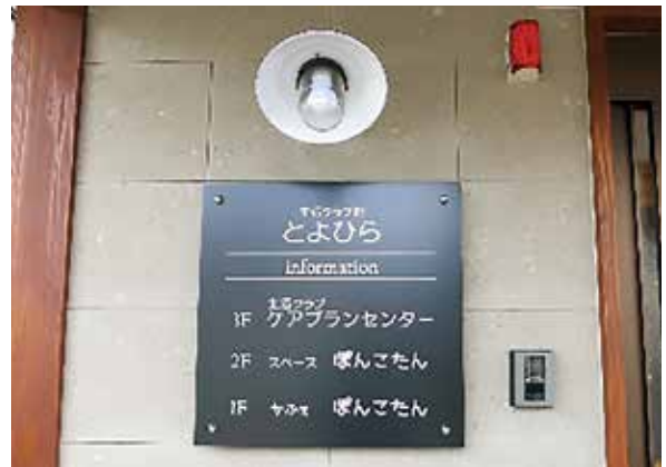
← 2020年6月にオープンした生活クラブ館・とよひら