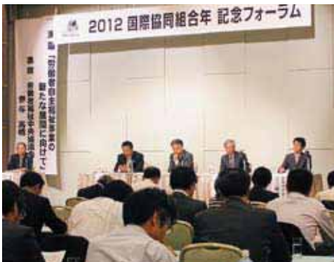
協同組合の意義を確認したフォーラム

による「記念フォーラム」が札幌市内にて開催され、約120名が参加しました。この実行委員会には、道労福協・道労金・