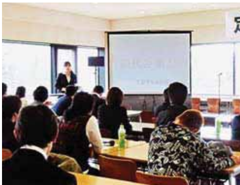
5月19日、学生委員会の運営により開催された総代会

学生総代を集うことは以前から学生の仕事として定着していましたが、教職員の総代を集うことや会場設営、受付、議長と多岐にわ